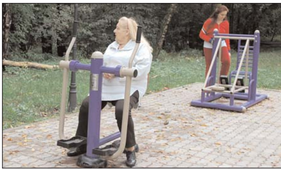
На фото: Измайловский проспект (было – стало)

Корреспондент газеты побывала в зоне отдыха и попросила жителей района поделиться мнением о произошедших переменах.