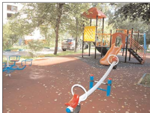
На фото: ул. 15-я Парковая, д. 33. корп. 4: было – стало